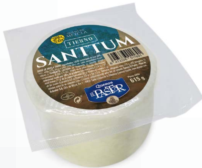
Tierno 550 gr