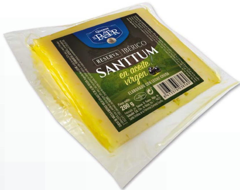
Cuña en aceite